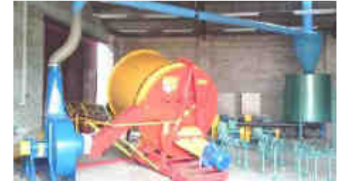
Utilaj pentru prepararea compostului din materiale vegetale – model experimental dezvoltat în cadrul unui proiect de cercetare - dezvoltare