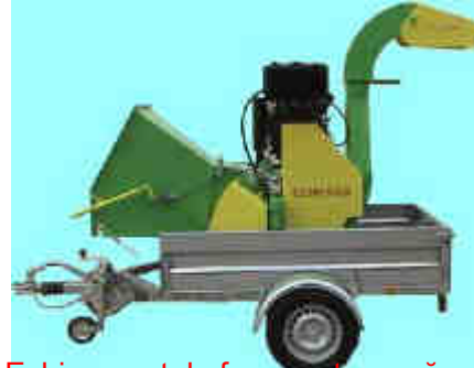
Echipament de fragmentare-mărunțire material lemnos – model experimental dezvoltat în cadrul unui proiect de cercetare - dezvoltare

Acestea vor duce la obținerea unor performanțe tehnico-economice foarte bune, cu randament și productivitate mai bune decât a utilajelor existente (învechite)